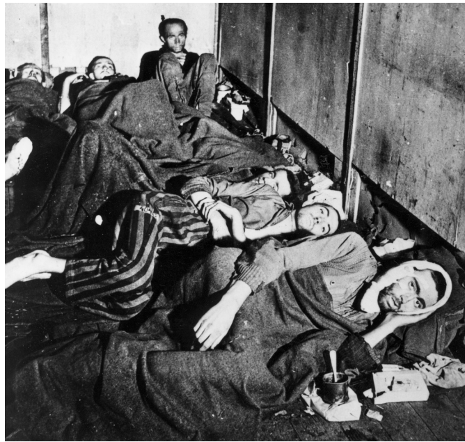
Befreite KZ-Häftlinge in einer der Unterkunftsbaracken

Die Toten wurden zunächst in Massengräbern um das Lager herum bestattet. Diese Gräber wurde zwischen 1954 und 1956 aufgelöst und auf den Lagerfriedhof umgebettet.